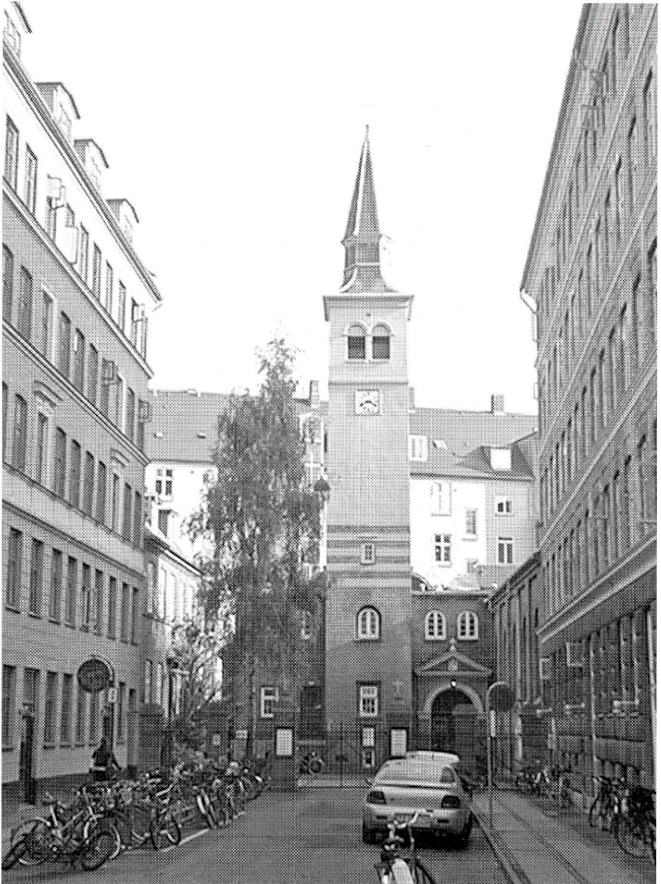
Fredens Kirke set fra Rymsgade. Tårnets lighed med rådhusårnet i København er ikke tilfældig. Tårnet er tegnet af Martin Nyrop og indviet i 1906 – få år efter Københavns Rådhus.