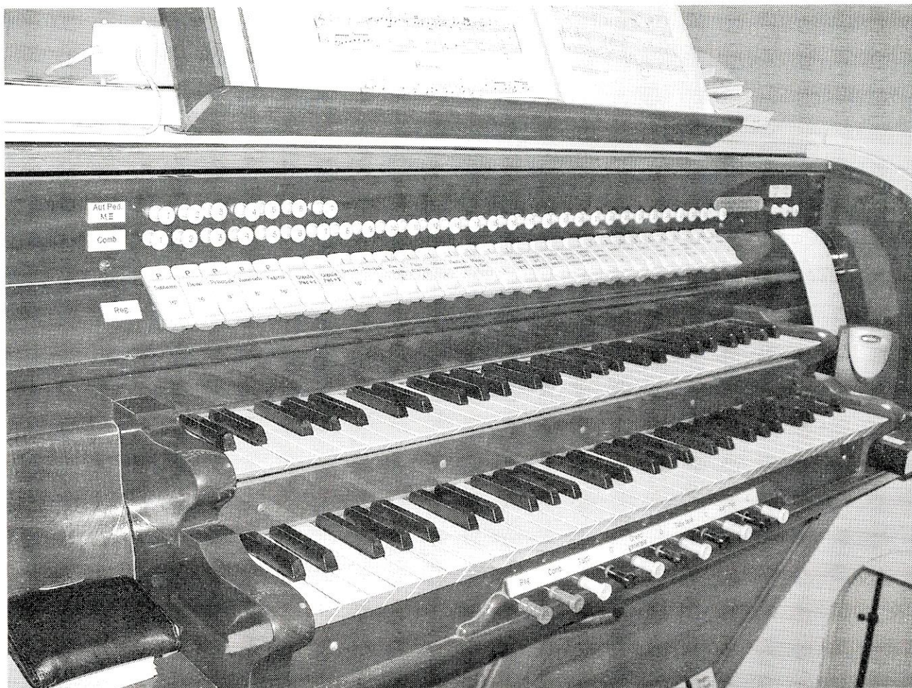
Spillebordet. Blankpoleret cubamahogni, elfenben og ibenholt. Der var klasse over datidens spilleborde.

det ene eller det andet. ”Barokiseringen” i 1955 var langt fra lykkedes.