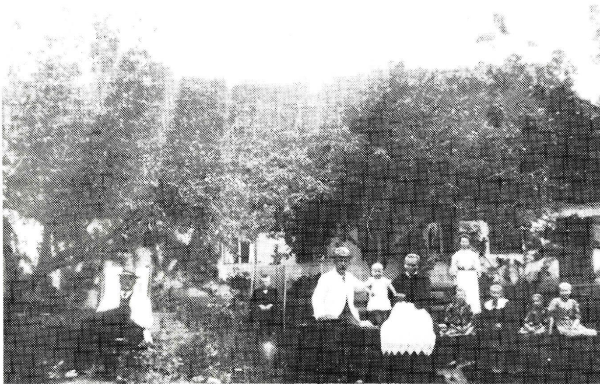
En sommerdag i haven, 1907.